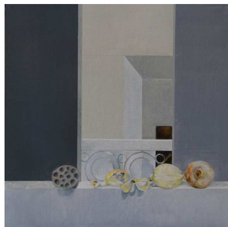
Huile sur toile