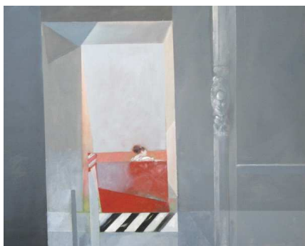
Huile sur toile