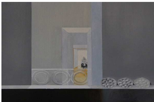
Huile sur toile