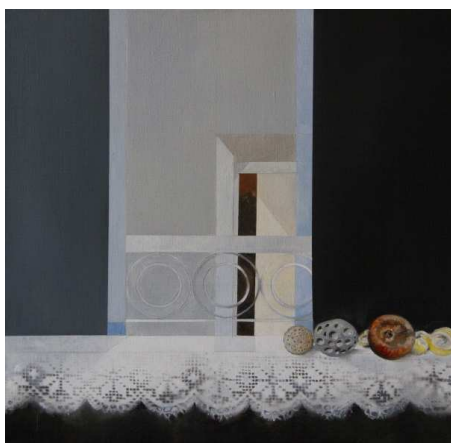
Huile sur toile