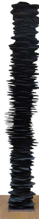
AAN V1 30x30x210cm

Œuvres présentes dans les collections privées et publiques