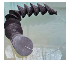
AV CAB 2 10x60x80cm