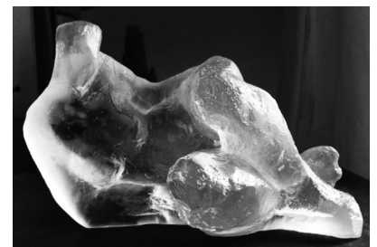
Aurore - Pâte de verre - 21L X 12H