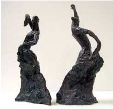
Flamenco - Bronze - 10L X 25H

elle expose à la galerie Peinture Fraîche depuis 2001