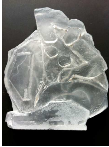
Odalisque 5 - Pâte de verre - 18L X 20,5H