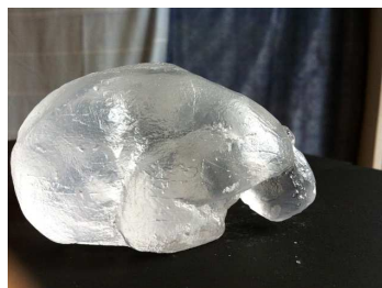
Le gallet - Pâte de verre - 9,5L X 5H