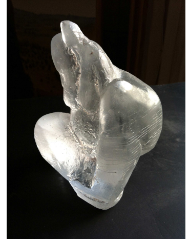
La gourmande - Pâte de verre - 13L X 10H