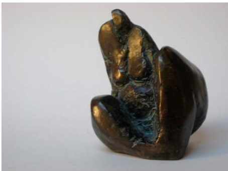
La gourmande - Bronze - 13L X 10H