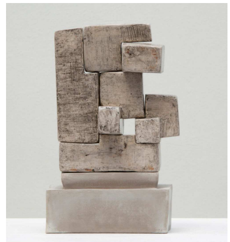
Construction- terre cuite blanche patinée grise