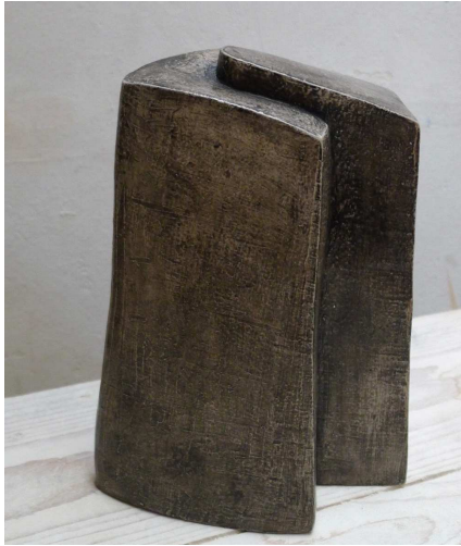
Couple - terre cuite blanche patinée grise