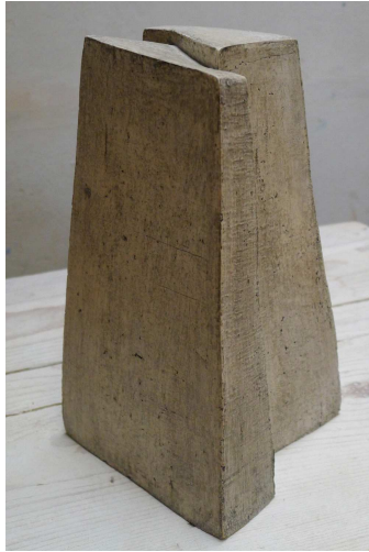
Couple - terre cuite blanche patinée beige