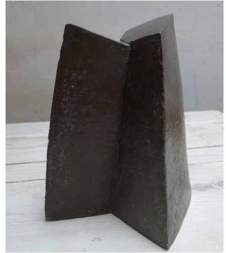
Couple - terre cuite blanche patinée noire