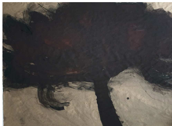
Gouache - 80X65cm

" S'immerger dans la nature comme un plongeur dans l'eau Participer à la respiration de la nature Pour cela cultiver attention et patience Passer de l'infinie lenteur du temps à la fulgurance de l'instant Connivence perpétuelle avec le soleil, le vent, les saisons Transcription sur le papier de ces moments de dialogue silencieux Comme un échange entre vieux amis qui donne nourriture et sens à une vie.