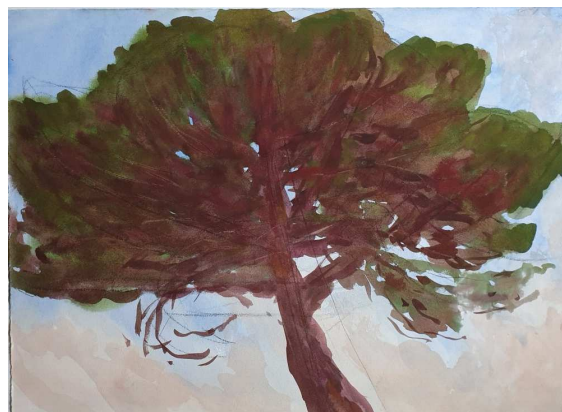
Aquarelle - 80X65cm