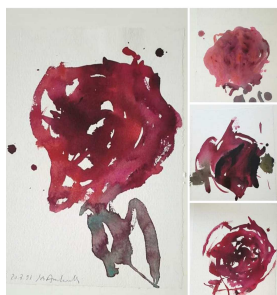
Aquarelle - 33X25cm

Bourges - Le Mouciau - SIAB - 13 Peintres - Mai 2015 Galerie Peinture Fraîche en Mars 2015 Galerie Guillaume - 75008 Paris - 2011 Salon Réalités Nouvelles - Paris - en 2006, 2007 et 2009 « L'art dans les chapelles » Été 2004 - Chapelle St André à Cléguerec (56)