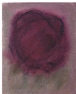
Aquarelle - 31X25cm