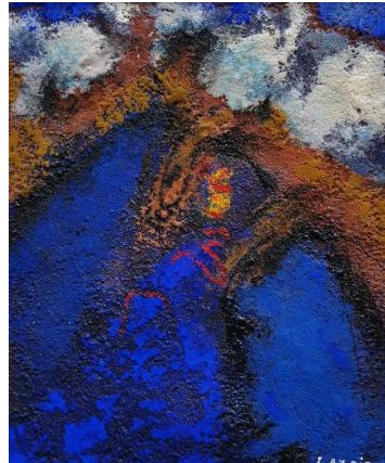
Sable et pigments - 19cm X 21cm