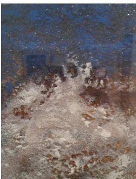
Sable et pigments - 13cm X 19cm