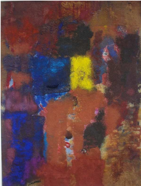
Sable et pigments - 53cm X 72cm