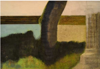
L'arbre et la colonne Peinture papier