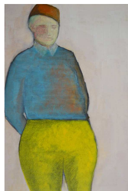
Désœuvré - Peinture papier