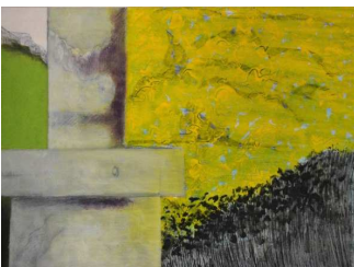
Forêt jaune guerrière Peinture papier