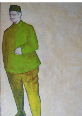
Désabusé - Peinture papier

Il expose à la galerie Peinture Fraiche depuis 1990