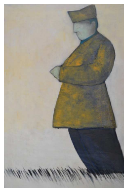
La pause - Peinture papier