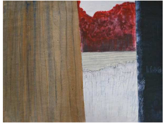
Monument d'automne - Peinture papier