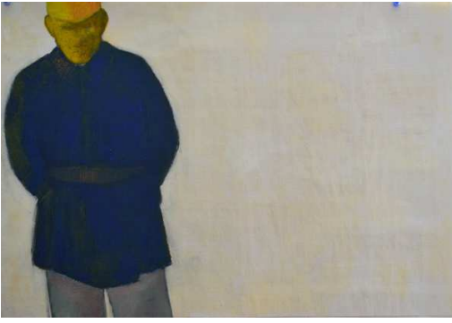
La photo - Peinture papier